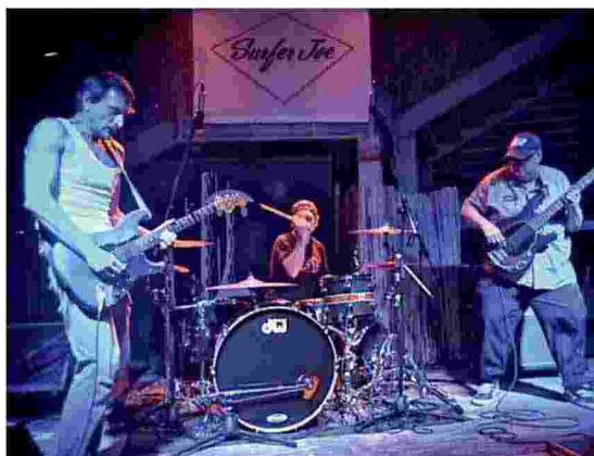
I toscani Tres Radio Express Service