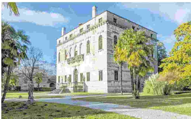
Un'immagine di Villa Correr-Dolfin

Questa settimana gli eventi torneranno ad animare il centro storico, con la 26ª edizione della rassegna "Blues in Villa" in programma venerdì 12 luglio. Il concerto, peraltro, si terrà in piazza Remigi, occupata fino a pochi giorni