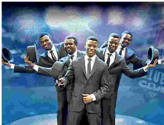
The Black Blues Brothers in Piazzetta Pescheria a Pordenone